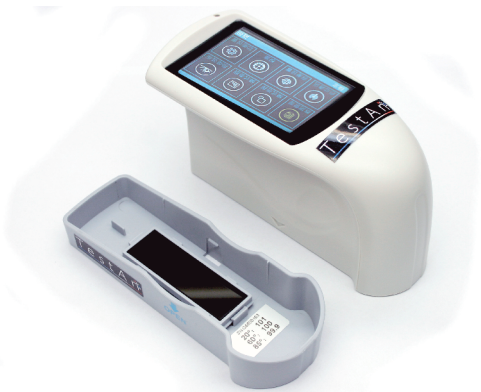
Połyskomierz DT 268 zgodny z normami ASTM D 523, ASTMD 2457

Połyskomierze serii Testan DT (wersja Advanced) umożliwiają transfer danych do komputera za pomocą portu USB. Uzyskane wyniki można przechowywać, eksportować i drukować.